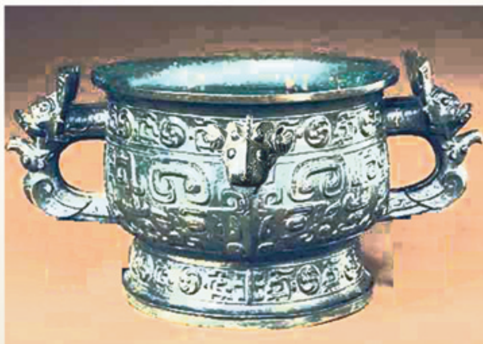
3千年前に中国で作られた神を祭る際の酒を入れる器

中国でも紀元前1400年から1100年頃に存在した殷王朝では青銅が使われ、極めて精密な文様の青銅器が作られていました。ただ、この殷での青銅技術が、中国を起源にするものか、中東付近から伝来したものかは分かっていません。ただ、現状では中東のように青銅時代以前の金属利用が明らかではないため、伝来した技術であるという見方が現状では有力です。