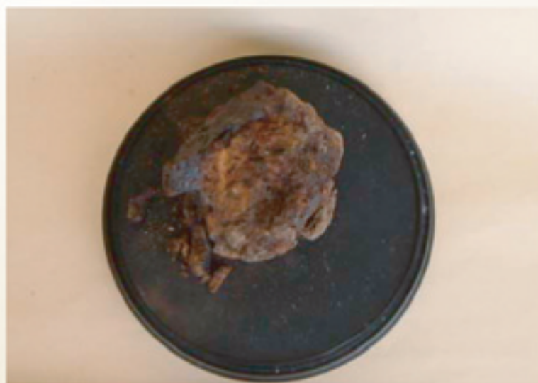
エトルリアの鉄滓 紀元前650年ころ中部イタリアにあったエトルリア王国の製鉄遺跡から出土

銅精錬のフラックスとして利用されていた鉄鉱石の一部は、還元されて鉄となり銅と一緒に得られましたが、銅を加工したり鋳込んだりする際に傷の原因となるため、不純物として注意深く削り取られていました。このように、人々は鉄鉱石から鉄が得られることや、銅に比べ鉄資源が豊富で手に入りやすいことも知っていましたが、青銅から鉄への移行には2千年近くの長い年月が必要でした。一般に鉄が使われるようになったのは、紀元前千年の初めになってからです。これは、鉄の溶ける温度（融点 1537^{\circ}\text{C} ）が、紀元前2千年当時に利用されていた青銅、銅、金、銀、鉛、錫などの他の金属に比べ 500^{\circ}\text{C} 以上高い温度であったためです。